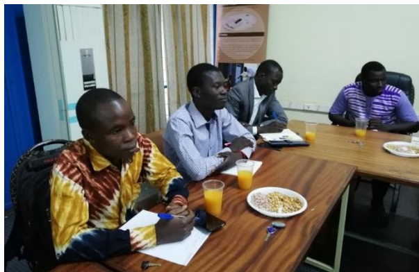
Rencontre du 12 décembre, Ouagadougou

Retrouvez-nous en 2019 pour de nouvelles rencontres qui s'annoncent passionnantes !