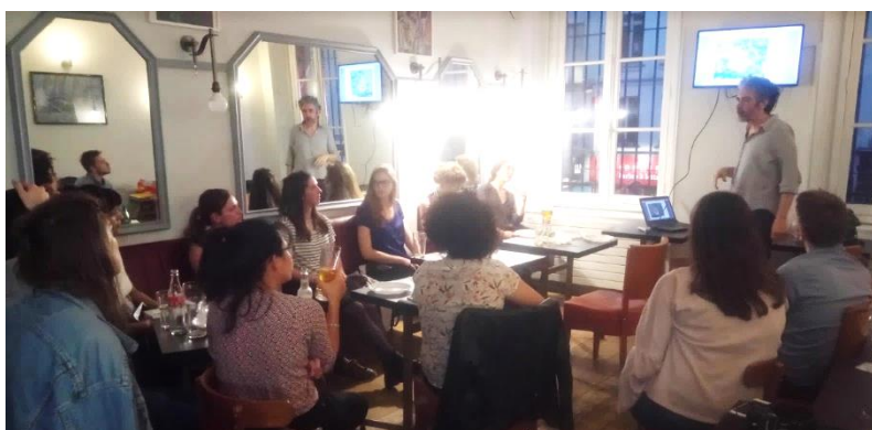
Rencontre du 19 avril 2018, Paris