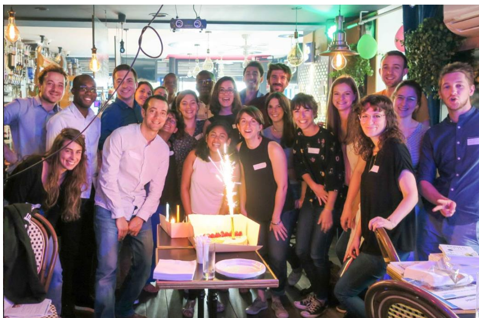
Célébration des 10 ans du réseau

Afin de pouvoir sonder cette nouvelle génération, trois « Junior Focus Group » ont été organisés à diverses reprises et ont été l'occasion pour des étudiants, jeunes diplômés et jeunes professionnels d'échanger sans tabou ni complexe avec les jeunes professionnels de Projection, de présenter leurs idées publiquement, de commencer à construire leur réseau.