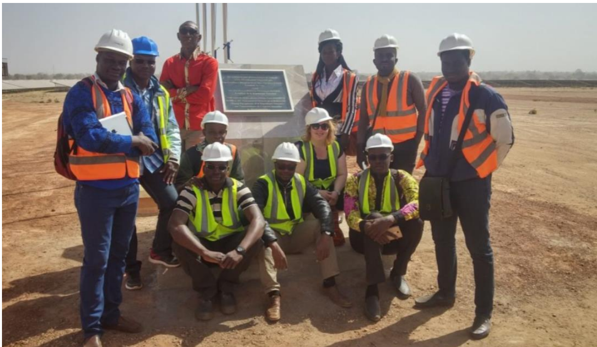
Visite de la centrale solaire de Zagtouli