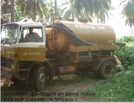
Un camion qui dépoté en pleine nature : « ce que Cure-net ne fera pas »